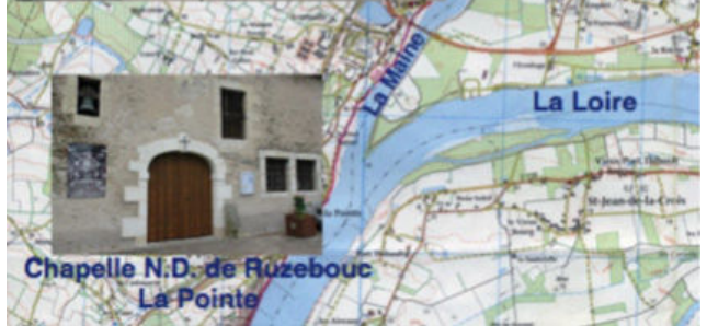
Chapelle N.D. de Ruzebouc La Pointe