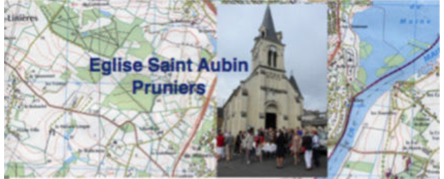
Eglise Saint Aubin Pruniers