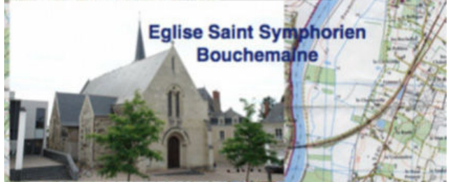
Eglise Saint Symphorien Bouchemaine