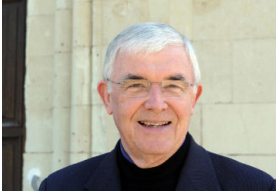
Monsieur le curé