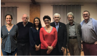
L'équipe d'Animation Paroissiale