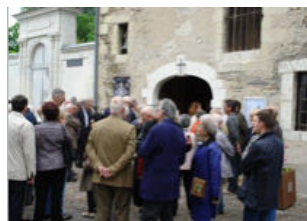
Chapelle Notre-Dame de Ruzebouc